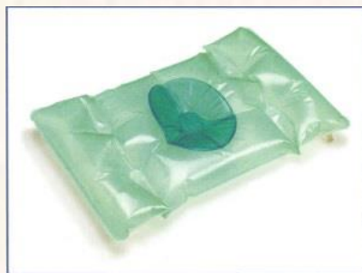
充氣連軟墊 (頭部使用)