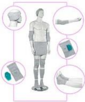
用繃帶固定軟墊 在不同身體部位

預防壓瘡，除了採取正確的轉移方法和正確卧姿外，還有不同質料的均壓用具可供選擇使用。請注意，沒有一樣用具是適合所有用者和處境，故此，治療師的評估和處方是非常重要的。